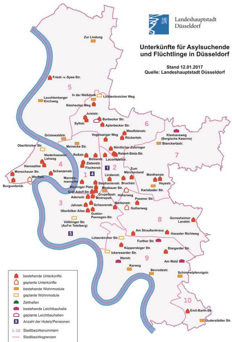
Abbildung 2: Unterkünfte für Asylsuchende und Flüchtlinge in Düsseldorf.