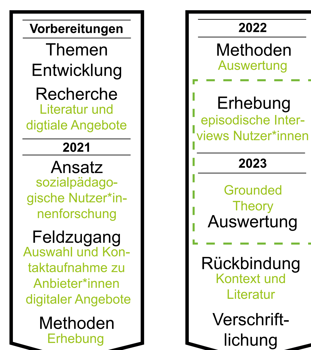
Abb. 3: Darstellung des Forschungsvorgehens incl. Zeitplan (kurz Version)

Andererseits wirkt sich zusätzlich die Digitalisierung, konkret der Mediatisierungsprozess, auch auf den Sozialraum aus (Kammerl 2018).