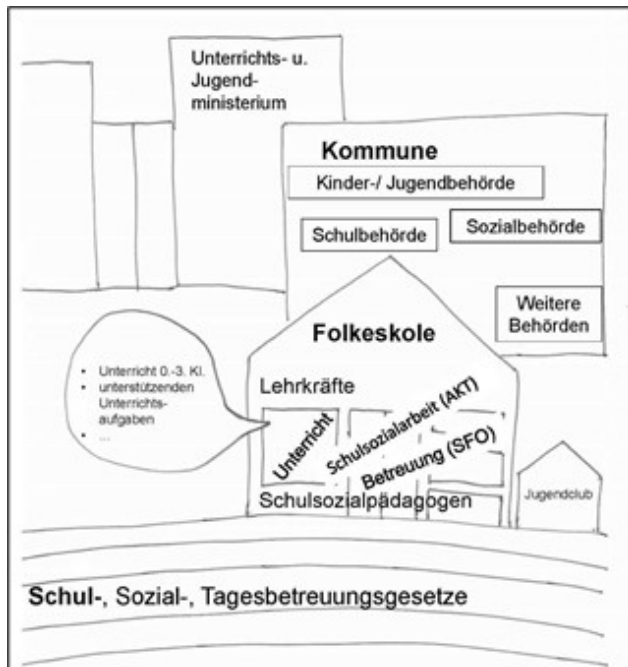
Abb. 1: Akteur*innen der dänischen Folkeskole (eigene Darstellung)

einer Gesprächspartner*in beispielsweise darauf hingewiesen, dass die Leitung des sozialpädagogischen Bereichs, die der Schulleitung unterstellt ist, ihr Büro direkt im Schulleitungstrakt hat. Die ehemaligen Lehrer*innenzimmer wurden in „Personalraum“ umbenannt und stehen allen Berufsgruppen zur Verfügung. Auch das kreisförmig angelegte Organigramm einer der Schulen versinnbildlicht das Bemühen der Schulleitungen um Zusammenarbeit und Gleichrangigkeit über unterschiedliche Verantwortungsgrade und Ausbildungen bzw. Professionsgrenzen hinweg.