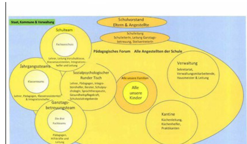
Abb. 2: Organigramm einer Folkeskole (Grafik: Maria Bælum Mauria, Schulleiterin)

Die durch das Folkeskolelov angestoßene Reform konzentriert sich auf das pädagogische Geschehen, Bildung und Erziehung in der Schule, wozu sozialpädagogische Kompetenzen genutzt werden sollen. Die im Verständnis der Schulsozialarbeit enthaltene präventive, aber auch die Vermittlung von intervenierender Kinder- und Jugendhilfe (Haase 2017) wird in diesem Modell nicht systematisch erfasst, gleichwohl führen die Gesprächspartner*innen Institutionen der intervenierenden Kinder- und Jugendhilfe an, die der Schule zur Seite stehen.